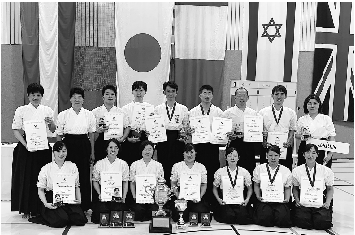
2019年にドイツで開催された世界なぎなた選手権大会で完全優勝を果たした日本代表団（前列右から4人目が筆者）

自分がどうなりたいかを明確にし、常に意識し行動することによって理想の自分になることができる。私自身、修行の途中でおこがましいが、感謝の気持ち忘れず、技を磨き、心を燃やし、今より上を目指してほしい。