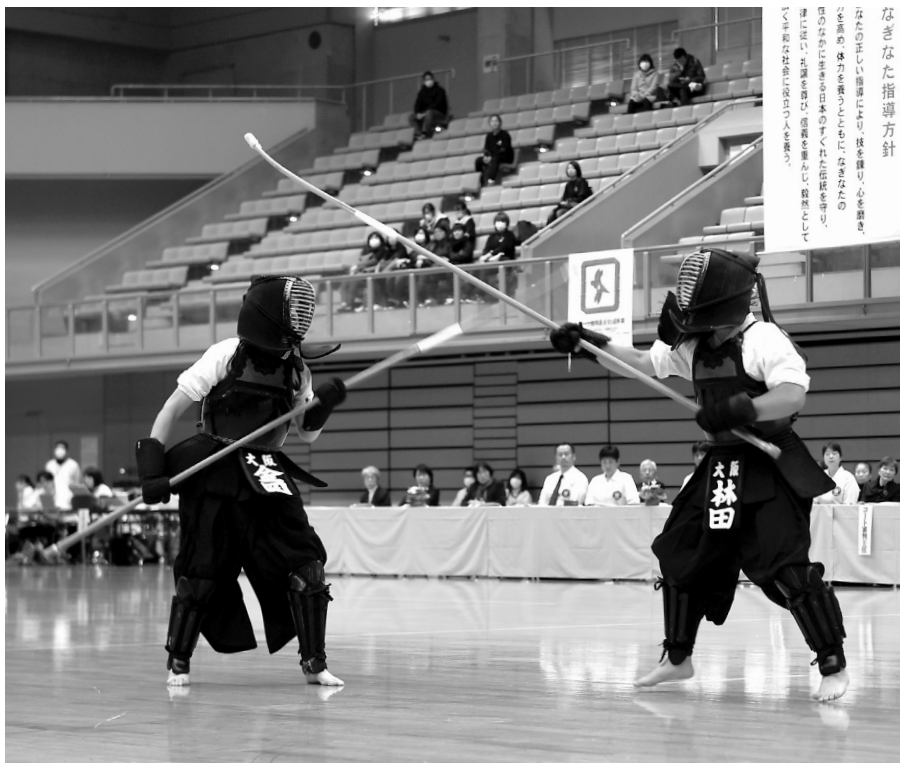
2019年に皇后盃全日本なぎなた選手権大会で史上4人目となる3連覇を達成した筆者(右)

ターハイに出場し、絶対に優勝したいと全員が同じ気持ちでした。試合前日、宿舍が用意してくれた夕食がトンカツだった。頑張つてという意味で用意してくれたことはとても嬉しかったが、優勝を目指しているのに負けるわけにいかないと思い、宿