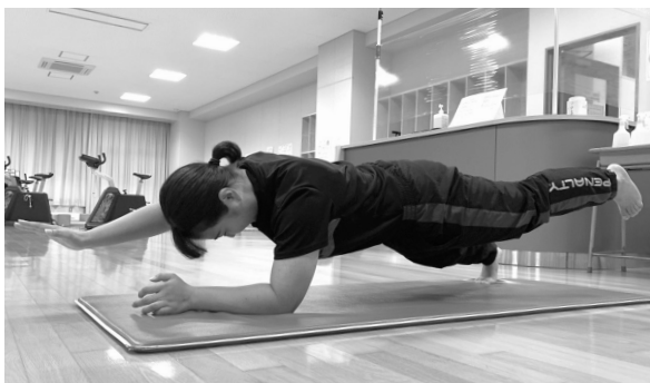
自在に体を扱えるようにするため体幹を鍛える筆者

高校1年生のインターハイ予選の団体戦で、何本も打突部位に正確に当たっていたのに一本にならなかった。なぜ一本にならなかったのかが分からなくて母が撮ってくれたビデオを見た。ビデオで見た自分の姿に愕 がく