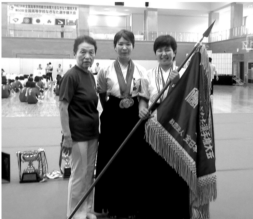
2011年、秋田で行われた全国高等学校総合体育大会で団体戦と演技競技で優勝を果たした筆者（右端）

ていたかもしれない。岩瀬先生への感謝の気持ちを試合の結果で返そうと思ひ、全国大会で優勝するため今まで以上に稽古に励んだが、中学3年間は結果