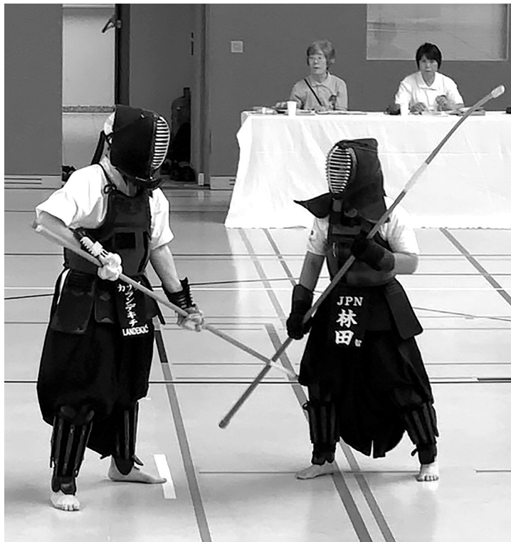
世界なぎなた選手権大会に臨む筆者(右) = 2019年