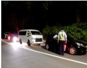
前日夜間からの駐車場待機（厳禁です）