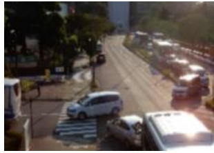
公園入口の大混雑（竹橋方面からの右折は禁止）