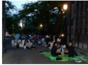
徹夜での入場列待機（厳禁です）